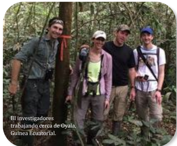
BI investigadores trabajando cerca de Oyala, Guinea Ecuatorial.