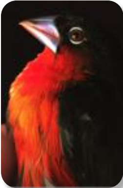
Estrilda Piquigorda Cabecinegra Spermophaga haematina

●Capturamos 780 pájaros en tres diferentes momentos en 2016, representando docenas de especies diferentes. Hemos documentado 215 especies en nuestra area de investigación nueva en Oyala, Guinea Ecuatorial