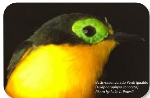
Batis-carunculado Ventrigualdo ( Dyaphorophya concreta )