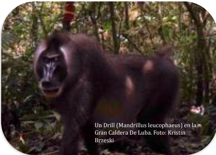
Un Drill ( Mandrillus leucophaeus ) en la Gran Caldera De Luba.

●Hicimos una expedición de 8 días a La Gran Caldera de Luba. Dentro de la caldera, hicimos encuestas audiovisuales para aves, pusimos trampas de cámara para mamíferos y anillamos muchas aves. Abajo se puede ver una foto de un Drill dentro de la caldera.